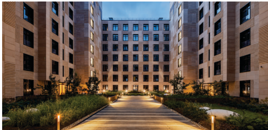
Тихие дворы с ландшафтным дизайном