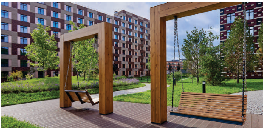
Зоны отдыха для взрослых и детей