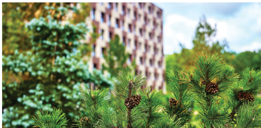
Озеленение территории, близость парков